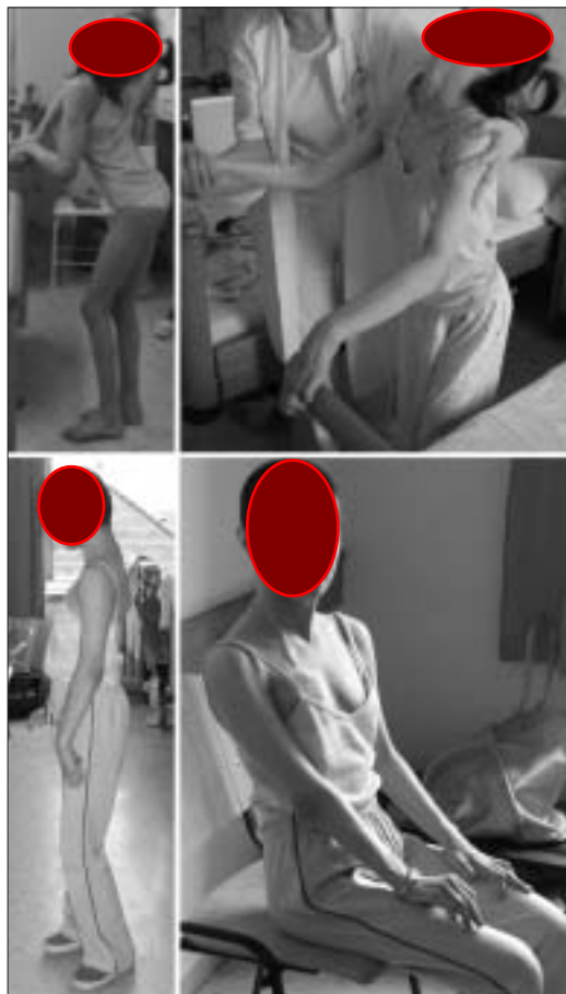
FELSŐ SOR: MŰTÉT ELŐTTI ÁLLAPOT. JÓL LÁTHATÓ, HOGY A BETEG ÖNNÁLÓAN, TÁMASZKODÁS VAGY SEGÍTSÉG NÉLKÜL MEGÁLLNI NEM TUD, HÁTÁT KIEGYENESÍTENI KÉPTELEN. ALSÓ SOR: MŰTÉT UTÁN 6 HÓNAPPAL ÁLLÓ ÉS ÜLŐ HELYZETBEN

mutattak a kiindulási állapothoz képest. A nyílt fázist 36 beteg fejezte be, közülük 18 betegnél észleltek 50%-nál nagyobb, 5 betegnél 75%-nál nagyobb mértékű javulást. Hat betegnél (közülük 1 DYT-1 pozitív volt) megfelelő elektróda lokalizáció mellett sem volt érdemi javulás. Összességében a hat hónapos stimulációt követően a klinikai tünetek (BFMDRS) 46%-kal, a funkcionális károsodás (DDRS) 41%-kal, a fájdalom 48%-kal, a depresszió mértéke 31%-kal (6) és az életminőség 30%-kal javult (63). A rövid követési periódus ellenére az adatok messzemenően meghaladják a gyógyszeres kezelés eredményességét.